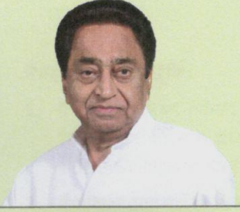
कमल नाथ मुख्यमंत्री, मध्यप्रदेश