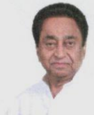
कमल नाथ, मुख्यमंत्री, मध्यप्रदेश