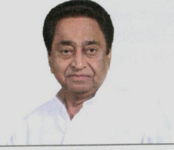
कमल नाथ मुख्यमंत्री, मध्यप्रदेश