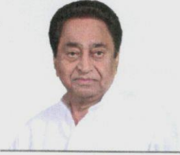
कमल नाथ मुख्यमंत्री, मध्यप्रदेश