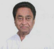
कमल नाथ, मुख्यमंत्री, मध्यप्रदेश